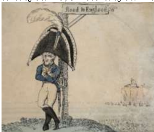
Isaac Cruikshank (graveur), George M. Woodward (dessinateur), Rudolph Ackermann (éditeur), Buonaparte's soliloquy at Calais , eau-forte coloriée, 21 septembre 1803, Musée de Boulogne-sur-Mer, © Ville de Boulogne-sur-Mer