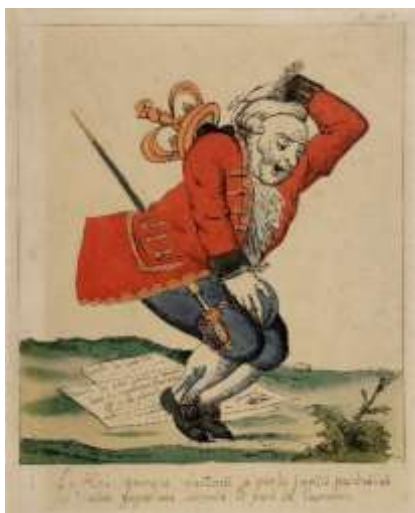
Anonyme, Le roi Georges sautant à pieds joints par-dessus les traités gagne une descente et perd sa couronne , eau-forte coloriée, 19 e siècle, Musée de Boulogne-sur-Mer, © Ville de Boulogne-sur-Mer